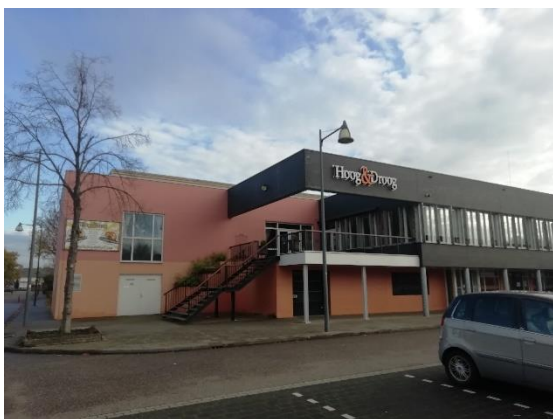
Vooraanzicht sporthal De Coevering

Begin 2021 werd subsidie aangevraagd en ontvangen volgens de Subsidieregeling Coöperatieve Energieopwekking (SCE) voor het zonnepark op het dak van de Geldropse sporthal De Coevering. Bovendien kan het dak van de gemeentelijke sporthal worden vernieuwd, want de brandverzekeraar is akkoord met de verbouwing. De gemeente moet de vernieuwing van het dak nu gaan inplannen. Naar verwachting wordt het maart 2022 voordat de 424 zonnepanelen van elk 450Wp geïnstalleerd kunnen worden. Omdat de regeling werkt volgens het Postcoderoosprincipe kunnen vooral inwoners van Geldrop en Mierlo hieraan meedoen.